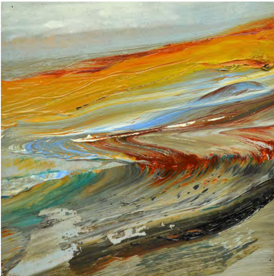
Hinrich JW Schüler – „Mikrokosmos“, 10x10 cm

Gemeinsam werden wir die unendlichen Möglichkeiten des kleinen Formates erkunden, gehen auf Entdeckungsreise im Kleinen und lassen in diesem reduzierten Format Tiefe und Ausdruck entstehen.