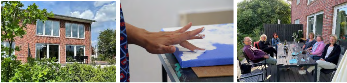
Atelier und Kursleben

Nahezu alle „Lokalitäten“ wie z.B. Restaurants, Cafés, Supermärkte sind vom Atelierhaus aus fußläufig zu erreichen ist. Ebenso schnell ist man im „Grünen“ um in die einzigartige Natur der Lüneburger Heide einzutauchen, die Ruhe zu genießen und neue Inspirationen zu sammeln.